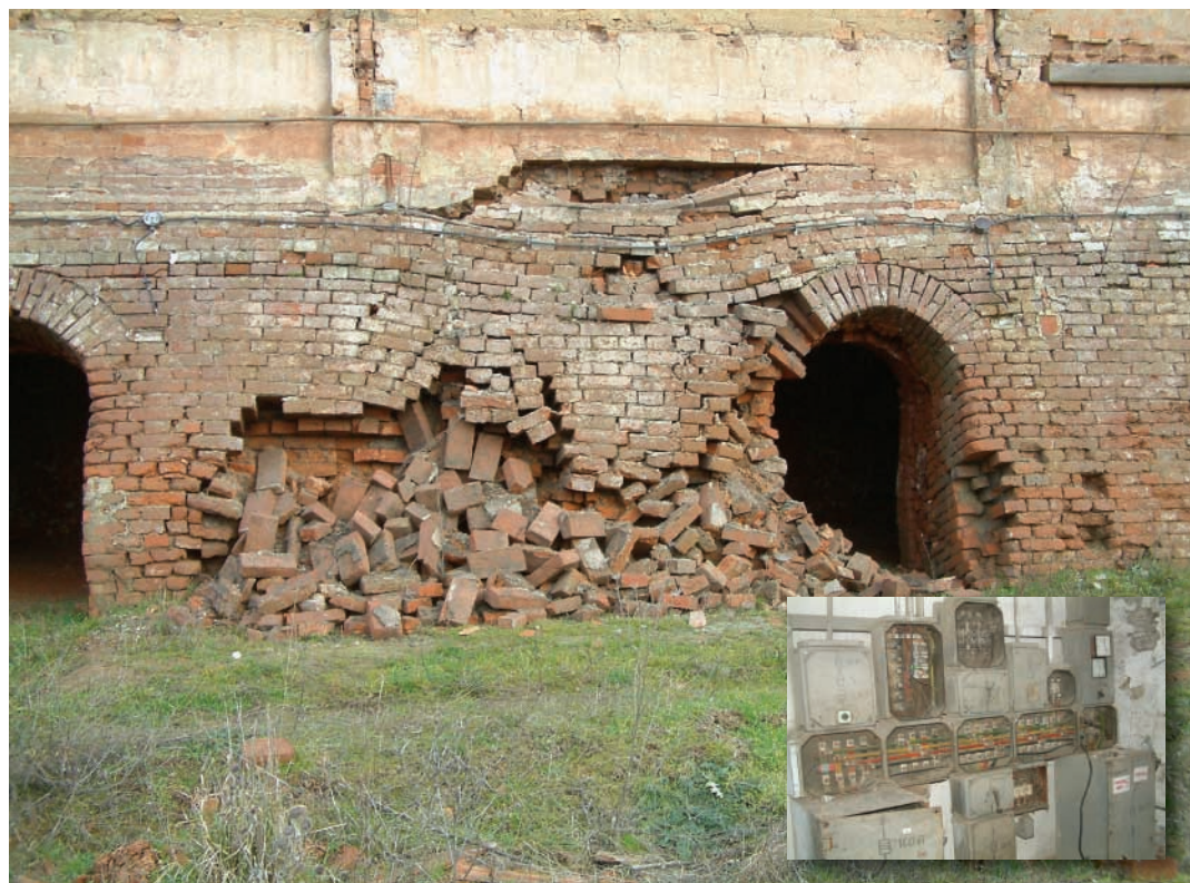
Az égető épület falai bedőltek. A kisképen a kapcsolórendszer „maradványai”