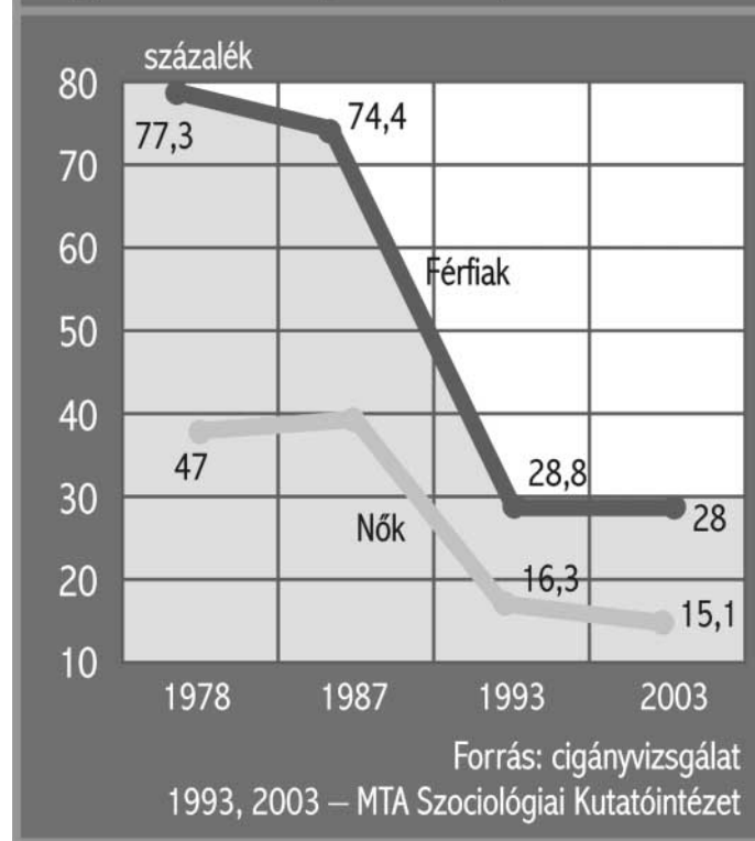
A cigány férfiak és nők foglalkoztatottságának aránya, 1978-2003

daságban gyakran alkalmaznak cigányokat, az már más kérdés, hogy meglévő szerződés híján ezek az emberek gyakran egyáltalán nem, vagy csak részben kapják meg a bérüket.