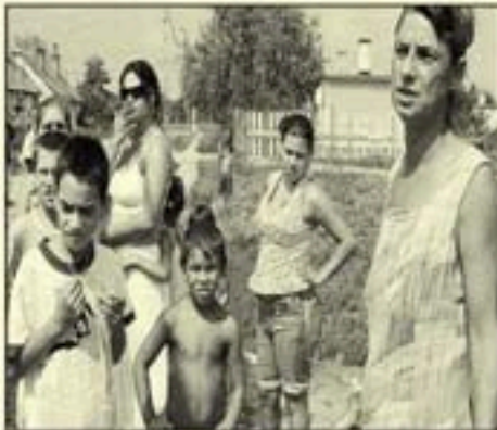
Hol kezdődik a leszakadás

A cigányság a következő években csak a folyamatos leszakadásra, hátrányos helyzete mélyülésére és kiszolgáltatott állapot fokozódására számíthat. Mindennek az oka a cigány politikai elit többsége, akik asszisztáltak a kisebbségi törvény elfogadásához, konzerválva a társadalmi és gazdasági különbségek következtében kialakult feszültségeket.