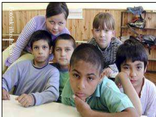
Több roma tanulónak is kölcsönt kellett felvennie

Az eredeti határidő szerint a diákok tavaly december 30-ig kellett volna értesíteni arról, hogy nyertek-e