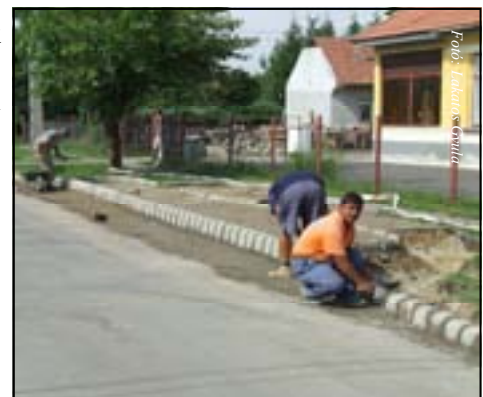
Készül a Hunyadi téri buszváró

A 70 millió forintos beruházás minimális önerőt igényelt a városi önkormányzattól, a kivitelezést