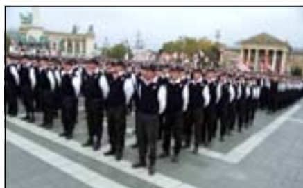
Kövér László szerint nem kell a Gárda

da nem kell, hiszen a rendet fenntartani ott van a rendőrség, ezért a Gárdát fel kell oszlatni. Ma már világos, melyik pártnak kell a Gárda, a Jobbiknak. A Gárda még senkit nem mentett meg, nem is ártott ugyan, de véleménye szerint csak rettegésre, drága ruhában való masírozásra és félelemkeltésre jó. Növeleli a feszültséget a cigány és magyar, magyar és cigány között. Bár a képviselő nem lepődik meg ezen. Hiszen mit is várhatunk egy olyan kormánytól, mely gátlástalanul hazudik, lop és a nép akarata ellenére kormányoz - fogalmazott. A radikális Jobbik éppen az ezek miatt megkeseredett és a tehetetlenségtől dühös szegény embereket használja ki, meglovagolva ezeket az érzéseket, próbál rajtuk keresztül Parlamentbe kerülni, hogy részese lehessen a magyar politikai elitnek - értékelte a hazai belpolitikai helyzetet békési politikai fóruma előtt lapunknak Kövér László, a Fidesz alelnöke.