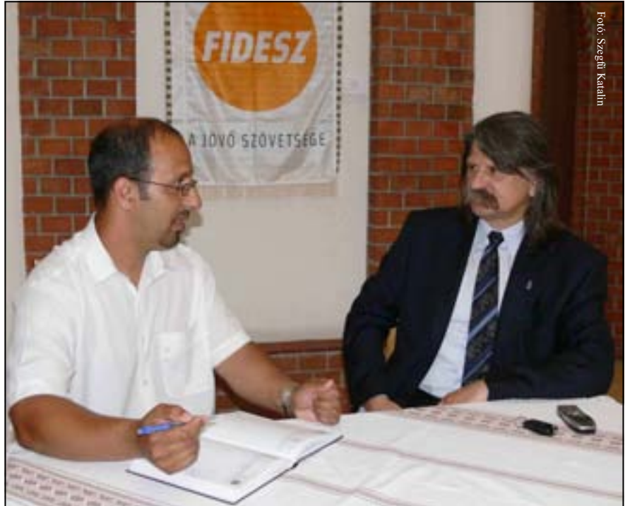
Kövér László, a Fidesz alelnöke nyilatkozott a Roma Oldalnak

Kövér László szövege a romapolitikáról is. Véleménye szerint a romák nagy többsége önhibájukon kívül került nehéz helyzetbe. Viszont akik a bűnözést választották, azok rosszul döntöttek, ugyanis ezekben a családokban nagyobb a lehetősége a generációról generációra történő bűnözési példának. A fiatalokra utalva tette hozzá: tanítani és taníttatni kell őket. A tudáson keresztül visz az út afelé, hogy szaktudásra, értékteremtésre alkalmas ismeretre tegyen szert, amivel megjelenhet a munkaerőpiacon. A roma gyerekeket sokszor önhibájukon kívül halmozottan hátrányos helyzetűvé minősítik. Ez nem szerencsés, de ha már így történt, akkor olyan tanárokat kell képezni, akik felkészültek a speciális esetekre és tudják nevelni, ösztönözni a fiatalokat.