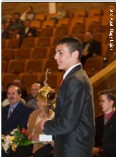
Fotó: Apáti Nagy Lajos