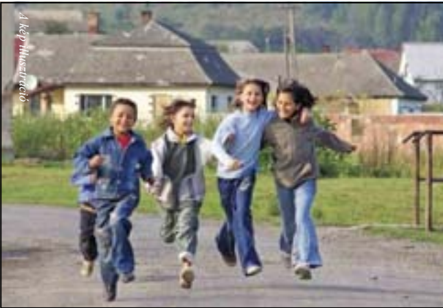
A remények szerint a döntés győztesei ők lehetnek

Döntés született, melynek értelmében alkotmányellenesnek nyilvánította a családi pótlék megadóztatásáról szóló rendelkezéseket, és azokat visszamenőleges azonnali hatállyal megsemmisítette az Alkotmánybíróság (AB).