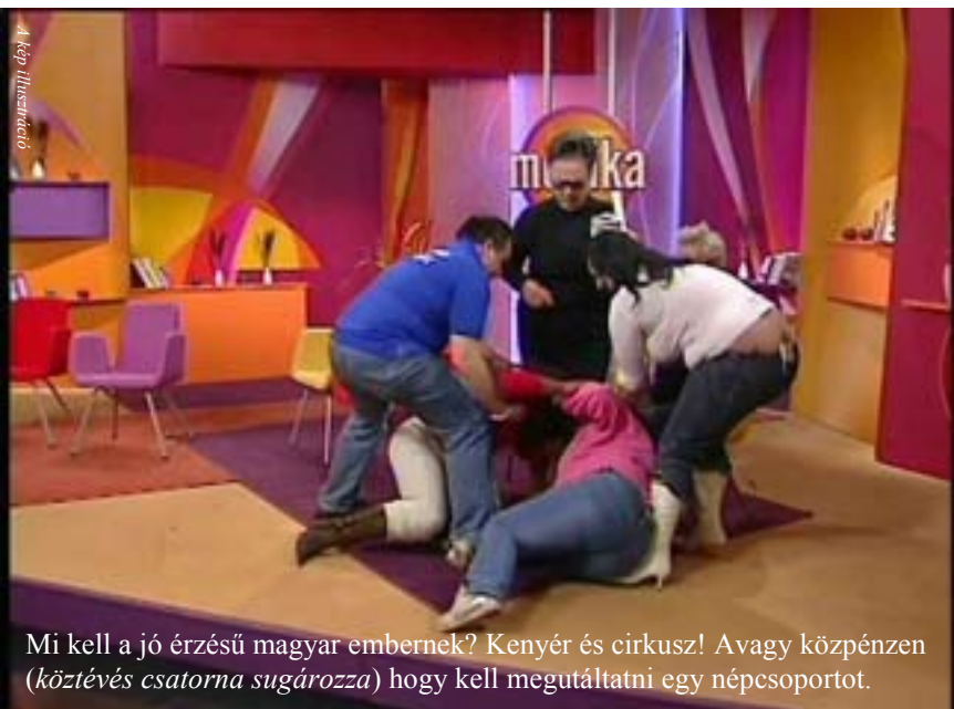
Mi kell a jó érzésű magyar embernek? Kenyér és cirkusz! Avagy közpénzen (köztévés csatorna sugározza) hogy kell megutáltatni egy népcsoportot.

választani, minden oldalon 12 bejátszás található. A Füstirtók Alapítvány felszólítja az Országos Rádió és Televízió Testületet (ORTT) e rasszista műsor végleges leállítására. Annak érzékeltetésére, hogy mi látható e 275 bejátszásban íme egy példa: Az „ADÁSBÓL KIMARADT JELENET - KÁROMKODÁS ÉS SZITKOZÓDÁS A MÓNIKA SHOWBAN” címet viselő klipben, az alábbiak történnek: Egy a rasszista sztereotípiáknak tökéletesen megfelelő kinézetű cigány házaspár veszekszik, lányuk is velük tartózkodik. Mikor bekapcsolódunk az eseményekbe, bemelegítésül a férj leköcsögözi az asszonyt, aki viszont magtallannak nevezi az urát. A férj azzal vádolja meg az asszonyt, hogy Olaszországban kurvát csinált a lányából, amit az asszony elismer, s a lány sem cáfol. Az asszony szerint a férj börtönben ült, amit a férj elismer. A férj szerint viszont az asszony és annak bátyja is annyit ültek börtönben, mint ő, amit a feleség nem cáfol... V.I.